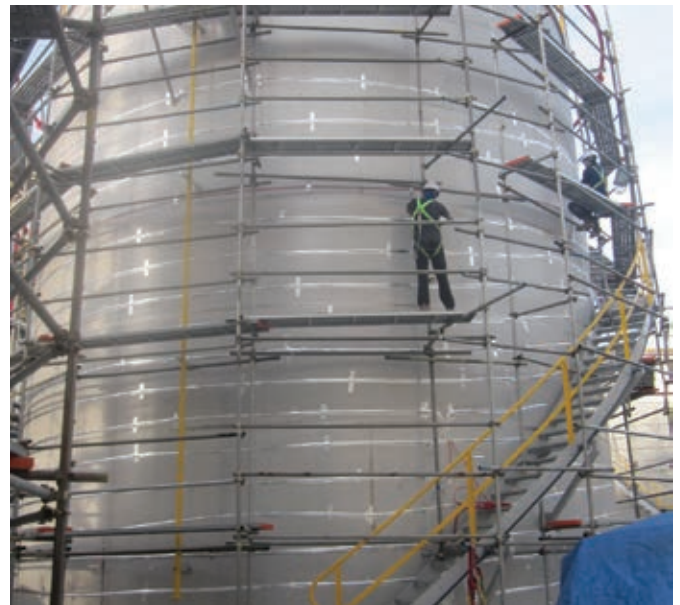
Фотополимерная оболочка FEP